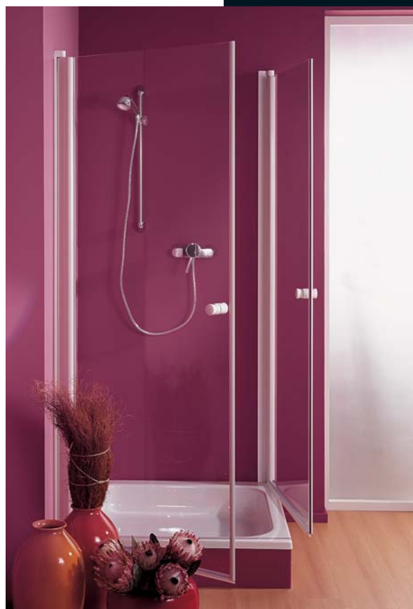
PH 531 TYPE 120

A classic in the GRAL shower system range! The PH 531 system is characterised by its continuous pivoting wall profile. The door is raised on opening and it closes automatically from an angle of approx. 30°. Since clamping profiles are used, no glass drilling is required.